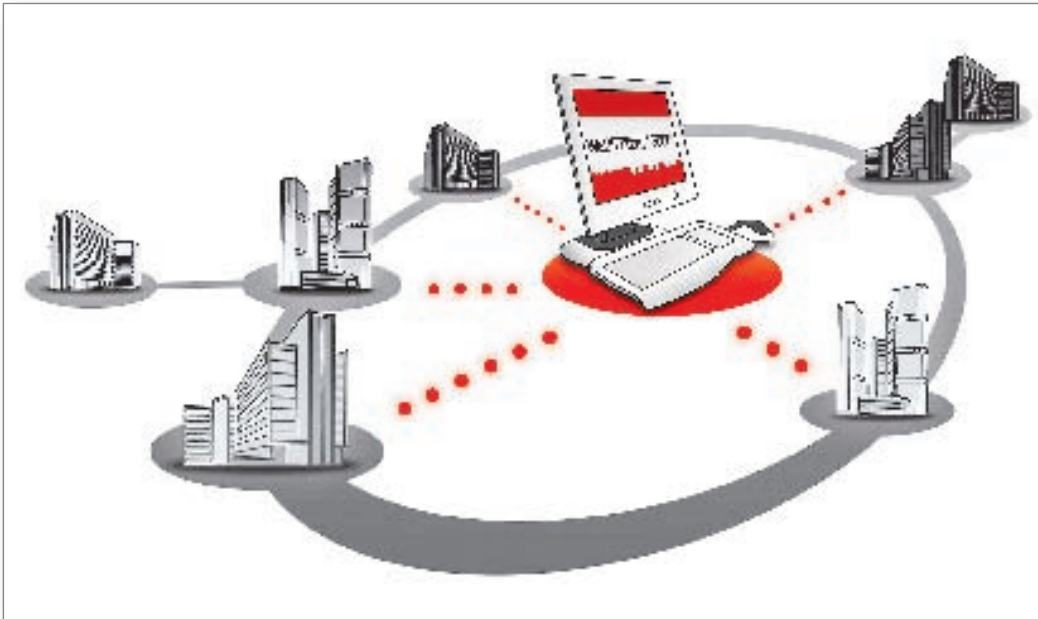
Bild 4: Eine webbasierte GLT-Software für intelligentes Gebäudemanagement wie z. B. WEBfactory Building ermöglicht Anwendern das Gebäudemanagement von einem oder auch mehreren Gebäuden an zentraler Stelle. Gleichzeitig schafft es die wesentlichen Voraussetzungen für eine konsequente Energieoptimierung

böse Überraschungen vermieden werden. Ein Vorteil sowohl für Mieter als auch Vermieter. Auch im Zusammenhang mit dem Energiepass, den Hausbesitzer verpflichtend ab dem 1. Juni 2008 ihren Mietern vorle-