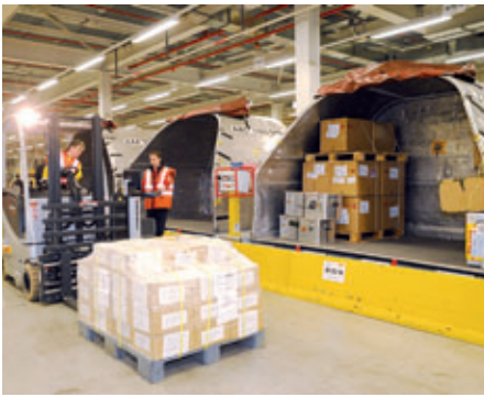
Pro Werktag werden etwa 1 500 t Fracht umgeschlagen